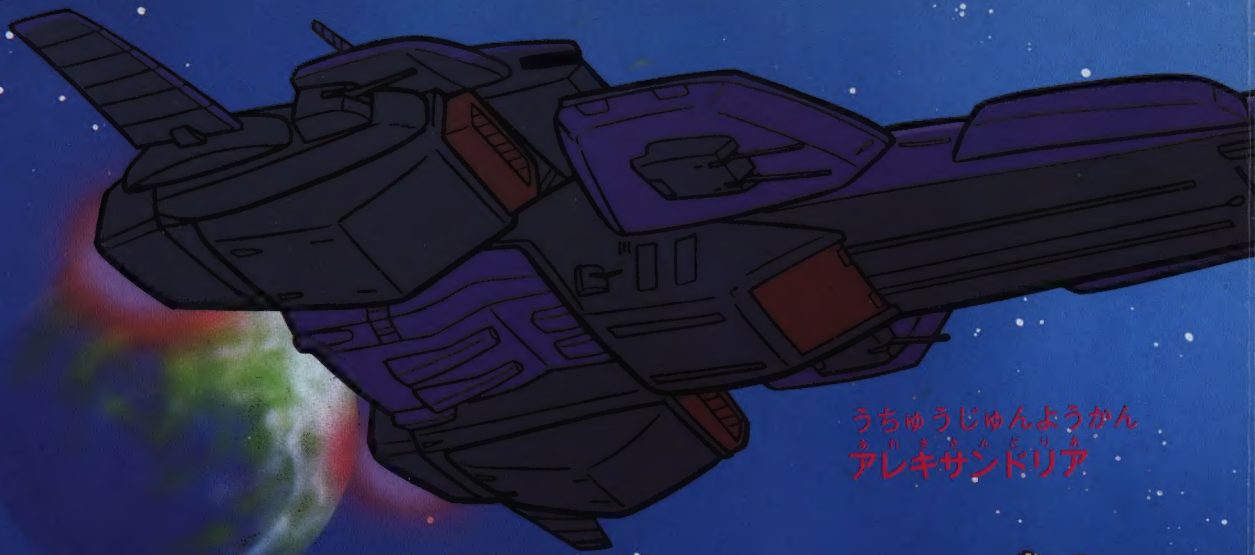
うちゅうじゅんようかん アレキサンドリア